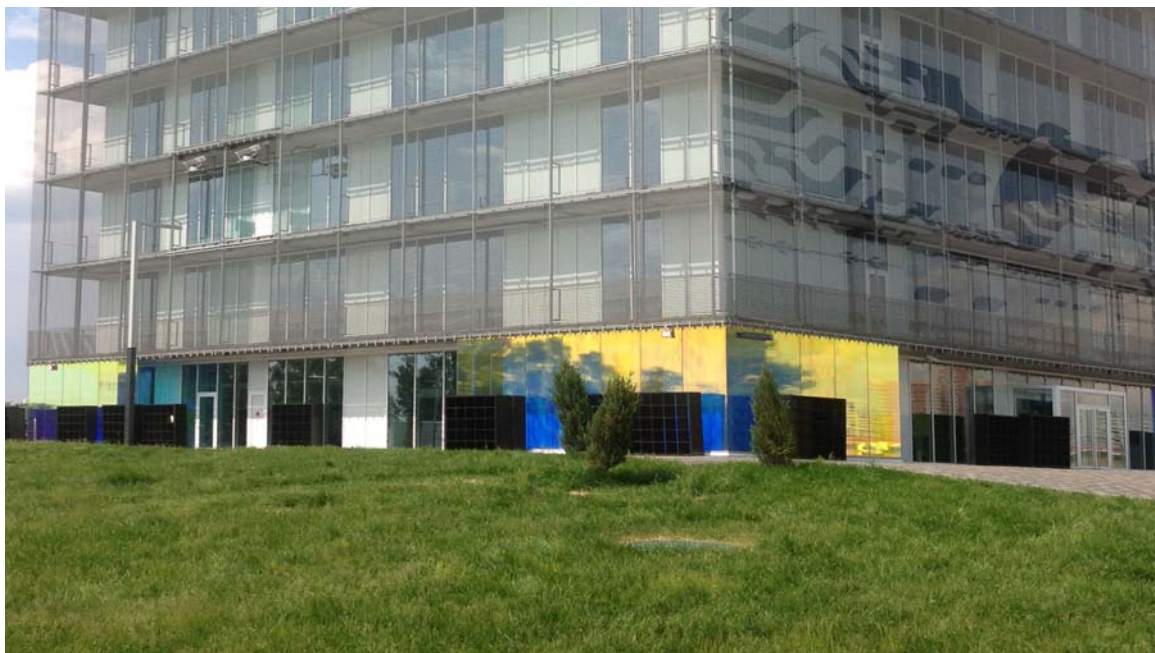
Бизнес-центр "Гиперкуб" Сколково( внутренний вид, установленное оборудование Siemens)